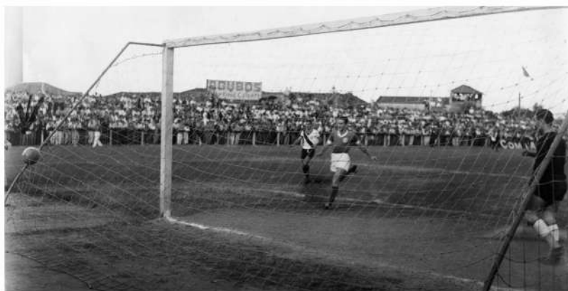
Dérbi de 11/07/1948 - Zuza, encoberto pelo goleiro, marca o primeiro gol do Guarani.